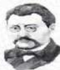
Ахмет Байтұрсынұлы - ұлт ұстазы